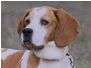
Un ejemplo notable de mucosas oscuras, trufa, comisuras y cerco de ojos

Las mucosas deben tender a ser oscuras, siempre de acuerdo con la capa. La pigmentación carnosa es perfectamente admitida en ejemplares blanco-anaranjados, castaños y claros.