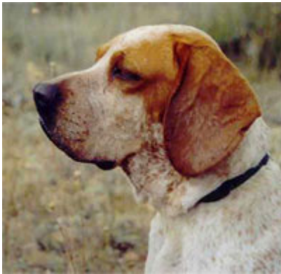
Oreja plana, borde redondeado e implantación generalmente alta

grandes, caídas, altas en su base, gruesas, planas y de punta redondeada. La inserción es amplia, delantera y más bien alta, por encima del arco cigomático. Caen hacia delante, con su borde anterior adosado a la cara, sin ningún pliegue. El borde inferior redondeado es característico. Extendida la oreja hacia delante debe sobrepasar bien la comisura labial.