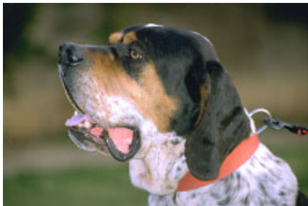
Típica distribución de las manchas "fuego" en un ejemplar tricolor

Ni en la antigüedad, ni en la cría moderna del pachón navarro, los colores han marcado los programas de selección. Los criadores anteponen siempre las facultades y aptitudes cinéticas a la preferencia de capas. Los pelos más característicos son blanco y anaranjado, blanco y castaño, blanco y negro; donde las manchas y motas -más o menos intensas- alternan sobre el fondo claro. También son admitidos, en esas capas, ejemplares monocolors de contrastada tipicidad. Algunos individuos son corbatos, acollarados y calzados. Son frecuentes los ejemplares tricolores con lavaciones o manchas enceradas "fuego", sobre las cejas ("cuatro ojos"), en las carrilladas, cara interna de las orejas y en perineo. En ejemplares castaños o negros se dan en ocasiones manchas "atizonadas", con pigmentación de desigual intensidad.