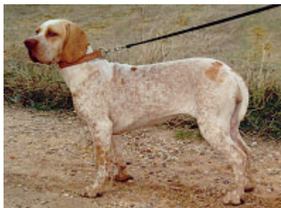
Ejemplar típico, pero muy bajo de agujas