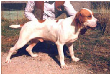
Angulaciones pronunciadas delanteras y traseras, propias de un perro de caza al trote