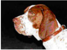
Mucosas con arreglo a la capa

La tradición también ha marcado las preferencias de ubicación de las manchas, pues se prefieren ejemplares que agrupen las manchas o placas en el plano dorsal, en cabeza, espalda, lomo o grupa.