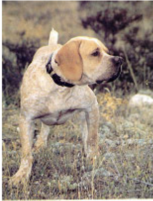
Macho de potente pecho, en actitud de muestra

El pecho es muy robusto, amplio, buena separación entre los encuentros, músculos pectorales desarrollados. La punta de la quilla debe sobresalir a la altura de la articulación del encuentro. La línea inferior del pecho debe rebasar por debajo el nivel de la articulación del codo, tanto en hembras como en machos. Costillar largo, redondeado, cilíndrico y profundo, bajando hasta rebasar la articulación del codo, costillas muy arqueadas, que demuestre gran capacidad respiratoria, resistencia y fondo. La región del esternón es larga, prolongada, remonta suavemente hacia el abdomen.