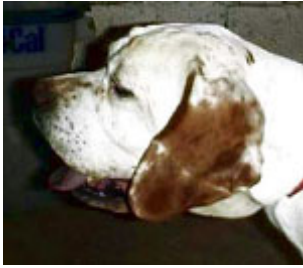
Perfil craneal y facial en una hembra muy típica

Cráneo ancho, de perfil recto o levemente convexo; senos frontales bien marcados, prominentes a veces pero sin exageración; potentes arcadas zigomáticas; maxilares de músculos potentes, equilibrados y nivelados; conforman un surco craneal medio que llega hasta la cara ; botón occipital muy bien marcado. Las hembras acostumbra a tener un cráneo más sencillo y ligero, proporciones más suaves y formas menos acentuadas.