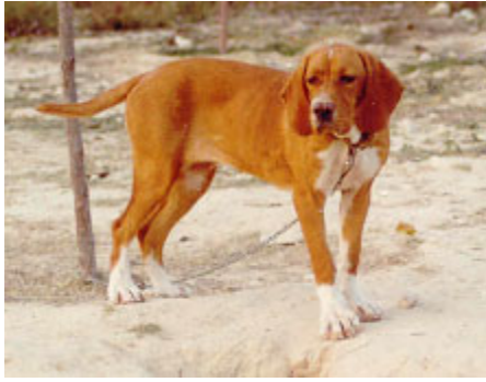
Capa monicolor, acorbatado y calzado

La tradición también ha marcado las preferencias de ubicación de las manchas, pues se prefieren ejemplares que agrupen las manchas o placas en el plano dorsal, en cabeza, espalda, lomo o grupa.