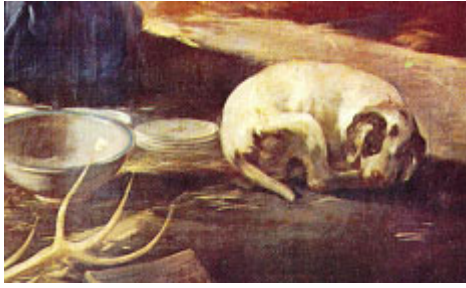
El corte tradicional de la cola consiste en despuntarla. Detalle de "El Cacharrero", de Francisco de Goya