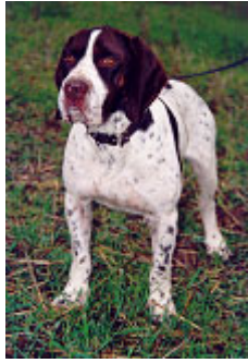
Aplomos frontales en un macho de dos años