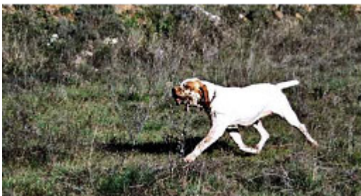
Estilo en la marcha, tranco adecuado y progresión horizontal

se manifiesta con movimientos de locomoción normales. En conjunto el Pachón Navarro debe ser un perro armonioso, proporcionado, que permita una marcha libre sin impedimentos, dinámica y fácil. La marcha típica de la raza es el trote, de marcado sentido horizontal al suelo, con un aire tosco pero con brío, cadenciado, levantando bien las extremidades, con progresión notable y fuerza en el paso. Se aprecia especialmente los ejemplares de amplio tranco y avance potente, tanto en planos llanos como en pendientes. Los defectuosos aplomos en estación deben ser tan ligeros que no se propaguen al sentido, ritmo y proporción del trote. En algunos ejemplares es manifiesta una leve ambladura en el sentido de la marcha. Los ejemplares que demuestren una clara inclinación por el galope o trote muy largo deben ser sospechosos de cruce. Ningún pachón debe dar sensación de pesadez en la marcha, ni torpeza. Los ejemplares bajos de agujas o de miembros muy desviados, que proporcionan un paso descompensado, deben también ser eliminados de la cría.