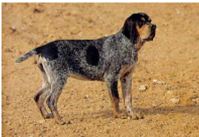
Línea dorsal, flancos y grupa característicos en una hembra adulta

musculado, de línea dorso-lumbar recta. Cruz destacada, baja y fuerte. Espalda bien inclinada. Lomo ancho , musculoso y flexible, ligeramente convexo en los ejemplares más recios.