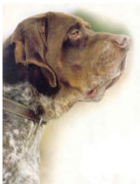
La oreja acartuchada, plegada sobre su eje, no es propia del pachón navarro