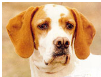
Ojos grandes, horizontales, mirada atenta y frontal.