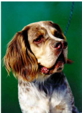
Ejemplar de pelo largo

La piel es gruesa en el pachón, moderadamente despegada del cuerpo formando algunos pliegues naturales. En algunas regiones se presenta delgada y deja traslucir la red venosa superficial en cara y orejas. En el Pachón Navarro de pelo corto, el pelaje es liso, de textura dura y apariencia basta, relativamente homogéneo por todo el cuerpo, no muy corto. En algunos ejemplares llegan a estar bien pobladas regiones habitualmente desprovistas de pelo como bragadas e ingles. El pelo es más fino en la cara, papada y las orejas. Se dan ejemplares de pelo largo, los llamados "sedeños", textura fuerte del pelaje, con flecos en orejas, corvas y brazos, que son las regiones más pobladas.