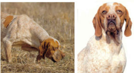
Implantación, Movilidad y longitud de cuello

De buen largo, grueso, fornido y con movilidad. Aspecto tosco por su anchura y su implantación musculosa en tronco y espalda. Borde superior ligeramente convexo, bien musculoso y móvil. La papada es pronunciada, pero no muy abundante. Su porte debe ser distinguido, seguro, elegante; de proyección horizontal en el trote, de suave inserción en el tronco.